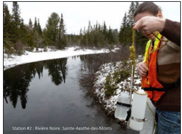
Station #2 : Rivière Noire, Sainte-Agathe-des-Monts

L'équipe d'Abrinord s'apprête déjà à réaliser le premier suivi mensuel de l'année 2015 et parcourra le territoire jusqu'en novembre, afin de prélever des échantillons sur 13 différents cours d'eau, pour un total de 34 stations d'échantillonnage. Trois points ont été ajoutés, soit deux sur le ruisseau Jackson (Morin-Heights) et un en aval du lac Raymond, sur la rivière du Nord (Val-Morin).